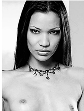
Parsley - Sage , tirage numérique, 30 x 40 cm, 2008

ON ABORDE L'UNIVERS DE JEAN-JOSEPH RENUCCI COMME ON RENTRE DANS UNE FICTION. Il n'est d'ailleurs pas impossible que l'individu lui-même produise l'effet d'un personnage de ro- man ou de film au point qu'il ne reste, après l'avoir rencon- tré, qu'un parfum inframine.